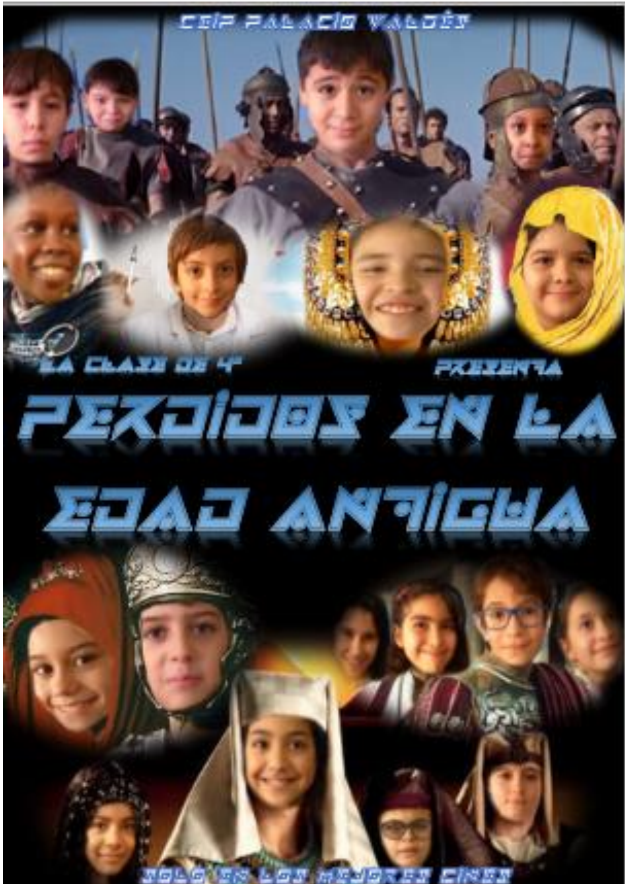
ANEXO 2: Cartel de la película para exponerlo en el colegio y cartelera.